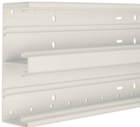
Socle de goulotte montage frontale BR 68x210mm couv. 2x80mm de PVC blanc crème