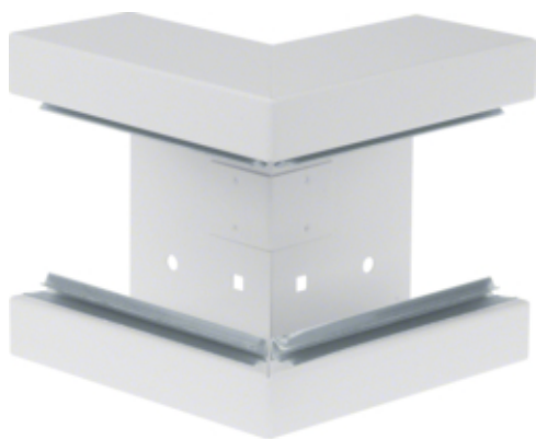
Außeneck aus Grundprofil aus Stahlblech zu BRS 70x130mm Oberteil 80mm reinweiß