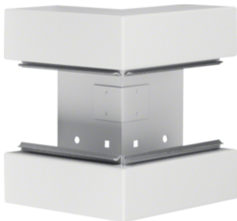
Außeneck aus Grundprofil zu BRS 68x170mm Oberteil 80mm aus Stahlblech cremeweiß