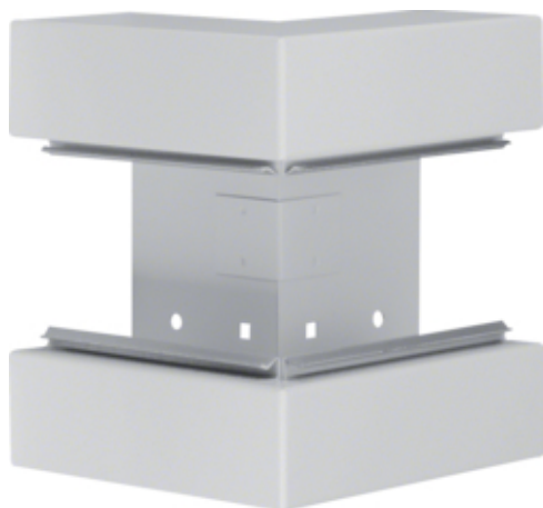
Außeneck aus Grundprofil aus Stahlblech zu BRS 70x170mm Oberteil 80mm lichtgrau