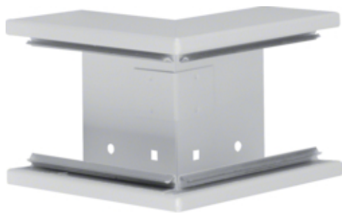
Außeneck aus Grundprofil aus Stahlblech zu BRS 70x100mm Oberteil 80mm lichtgrau