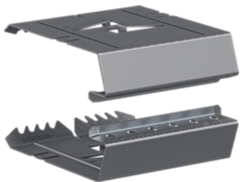
Kuplung Paar elektrisch/mechanisch Stahlblech zu BRS 100x130mm Oberteil 80mm

Abbildung ähnlich (Bild zeigt BRS10013091)