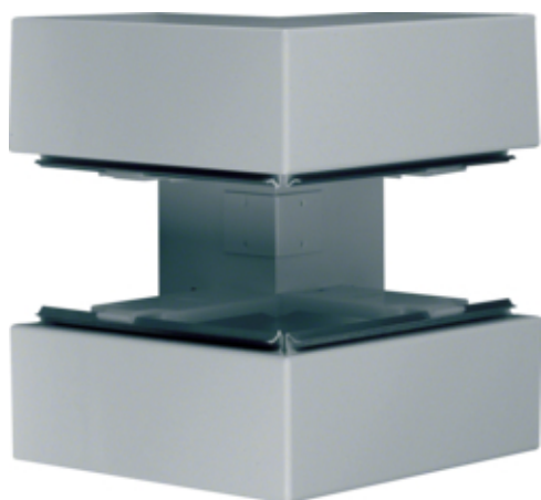
Außeneck aus Grundprofil zu BRS 100x210mm Oberteil 80mm aus Stahlblech verzinkt