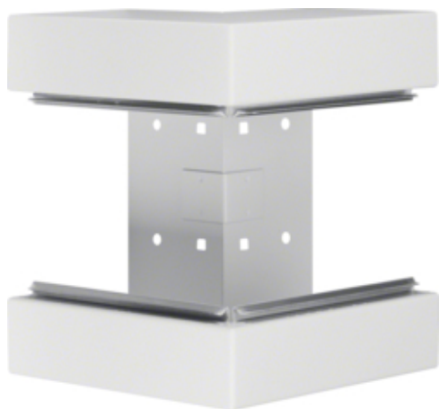
Außeneck aus Grundprofil zu BRS 100x210mm Oberteil 120mm aus Stahlblech reinweiß