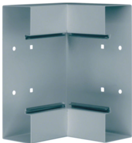
Inneneck aus Grundprofil zu BRS 68x210mm Oberteil 120mm aus Stahlblech verzinkt