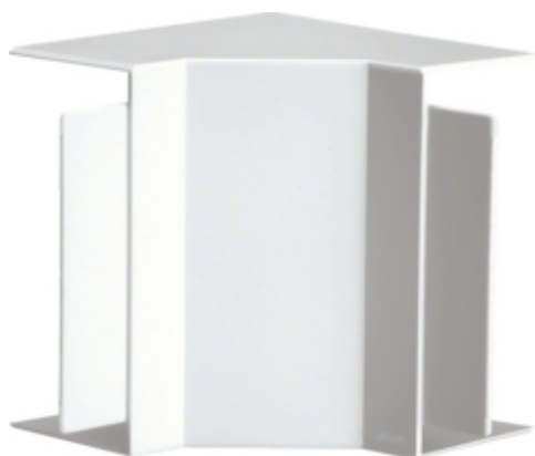
Inneneck aus PVC zu Leitungsführungskanal FB 60x130mm reinweiß