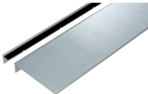
Couvercle avec brosse pour goulotte sol, BKB15085