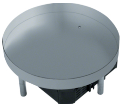
Nivb Edelstahlkassette R06 für 6 Inst-geräte blind Höhe i/a 23/28mm