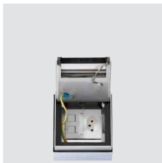
Dose 115x115 mit 2x FLF Gr. 1