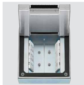
Dose 200x200 mit 2x3x FLF Gr. 1