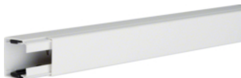
Goulotte 40040, blanc