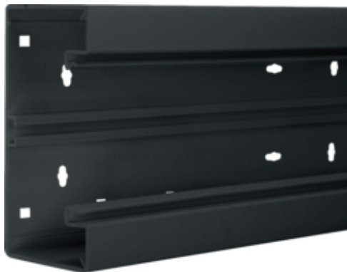
Socle de goulotte montage frontale BR 68x170mm couv. 80mm de PVC noir graphite