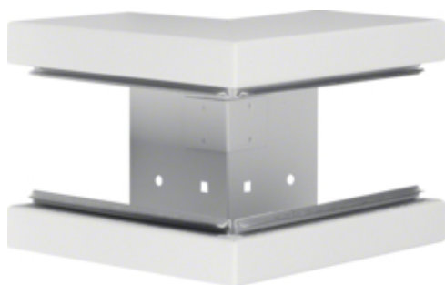
Außeneck aus Grundprofil zu BRS 100x130mm Oberteil 80mm aus Stahlblech reinweiß