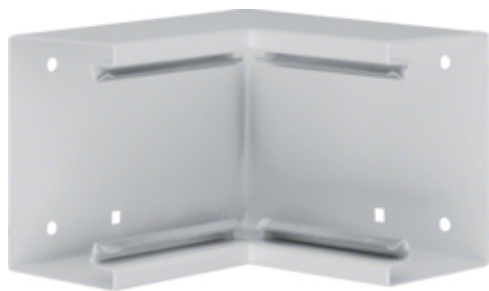
Inneneck aus Grundprofil Stahlblech zu BRS 70x100mm Oberteil 80mm lichtgrau