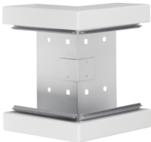
Außeneck aus Grundprofil zu BRS 68x170mm Oberteil 120mm aus Stahlblech reinweiß