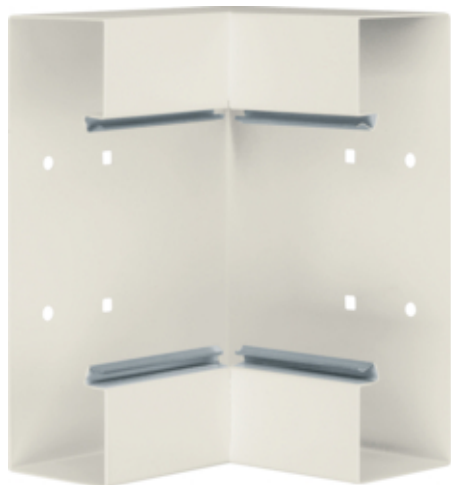
Angle int. en profil de base pour BRS 68x210mm couv. 120mm en acier blanc crème