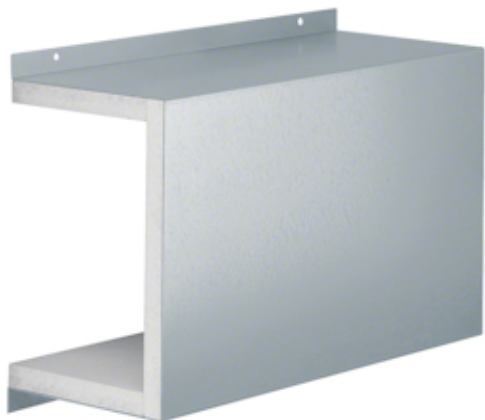
Schiebemuffe FWK30/3E I90/E30 100x160 vz