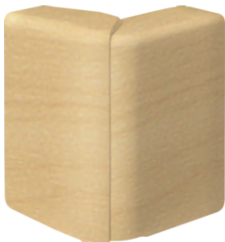
Außeneck einstellbar schnittkaschierend halogenfrei zu SL 20x80mm Dekor Ahorn