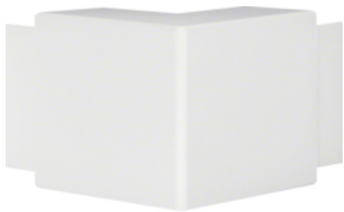
Angle extérieur, LF/FB 60110, blanc paloma