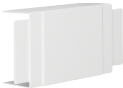
T-Stück aus Kunststoff halogenfrei zu LF/LFH/FB 60x110mm cremeweiß