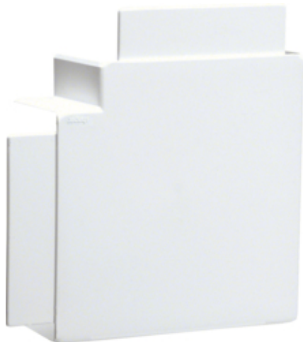
Angle plat, FB 60130, blanc paloma