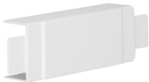
T-Stück aus Kunststoff halogenfrei zu LF/LFH 30x45mm cremeweiß