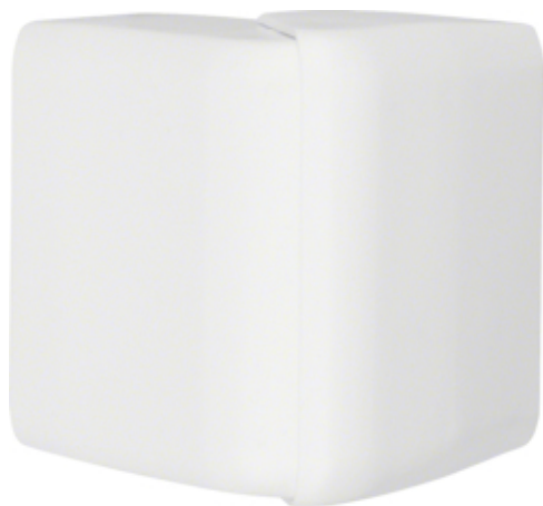
Angle extérieur variable pour moulure ATHEA 20x50mm en blanc pure